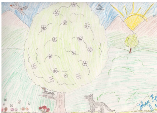
Јован Крстић, I/1

Пролеће је период када се природа буди из сна, када оживљава све на свету. Пролеће је годишње доба када можемо видети најразличитије тајне природе.