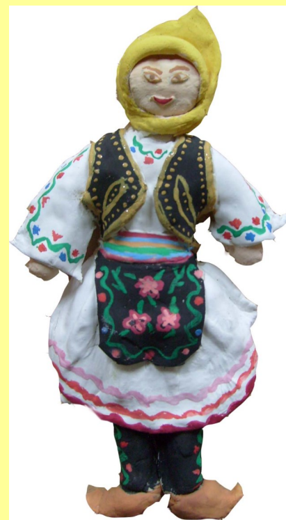
Вероника Томић, VIII/1