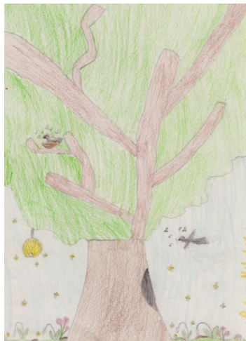
Петар Николић, I/1