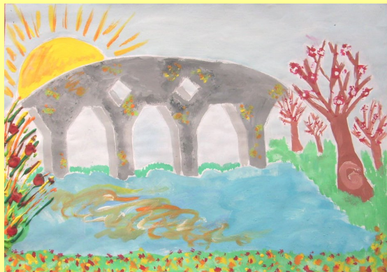
Наталија Тодоровић, VIII/1