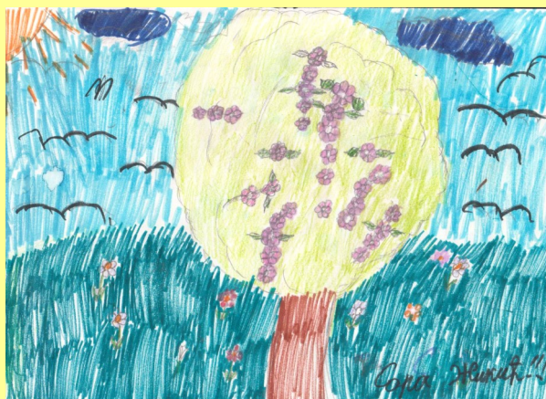
Сара Жикић, II/1